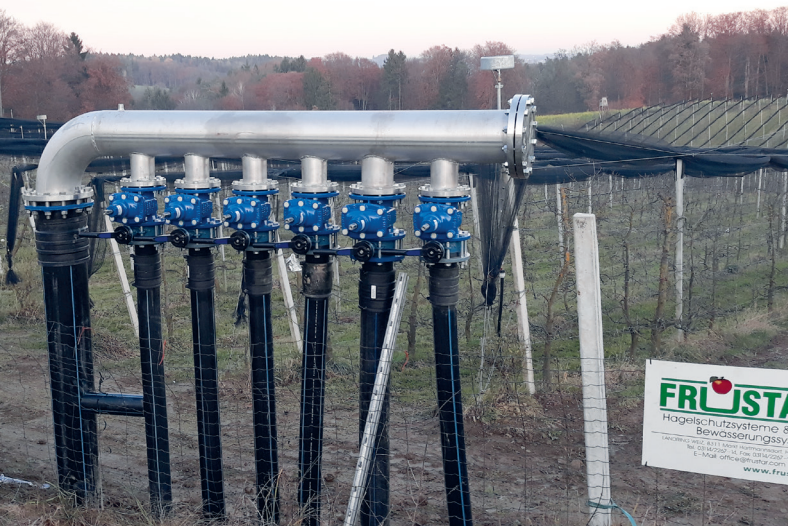
Einfache, händische Verteilungen