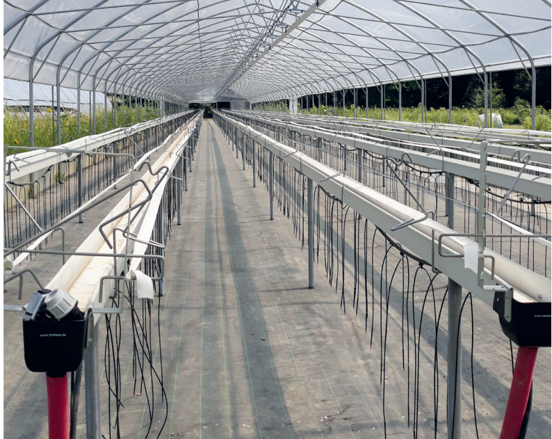
Exakte Substratbewässerung mit Tunnelkühlsystem