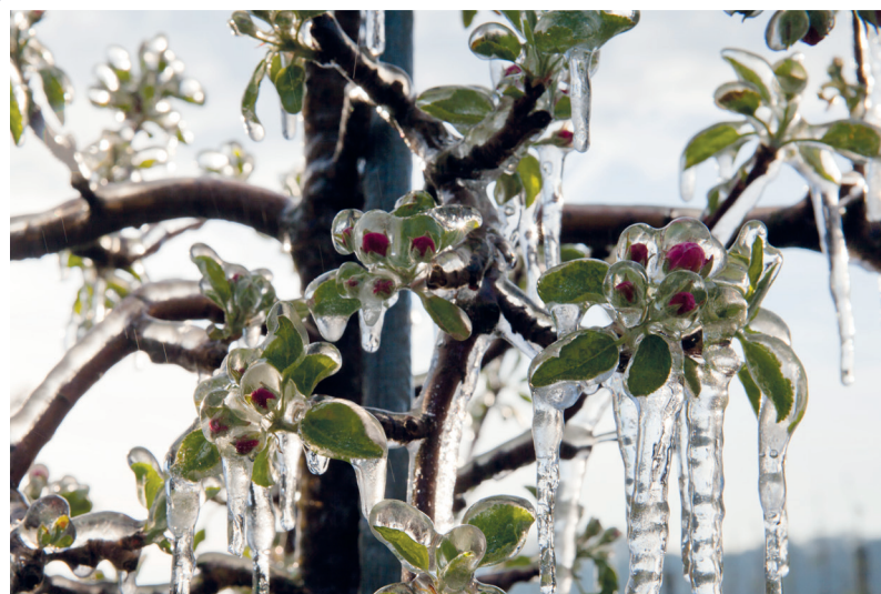
Temperatur -7,6\text{ }^{\circ}\text{C}