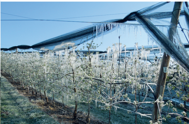
Seit 2005 erfolgreich im Einsatz