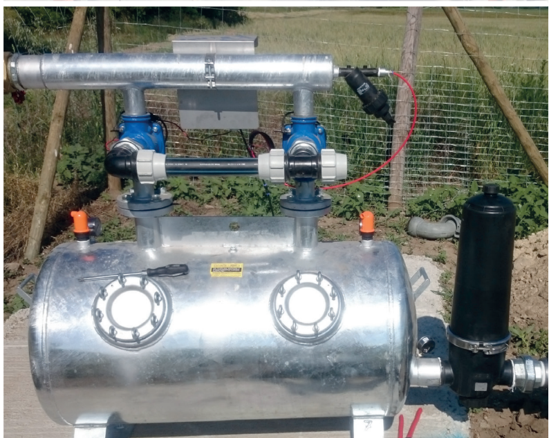
Automatische Filtersysteme für Teichanlagen