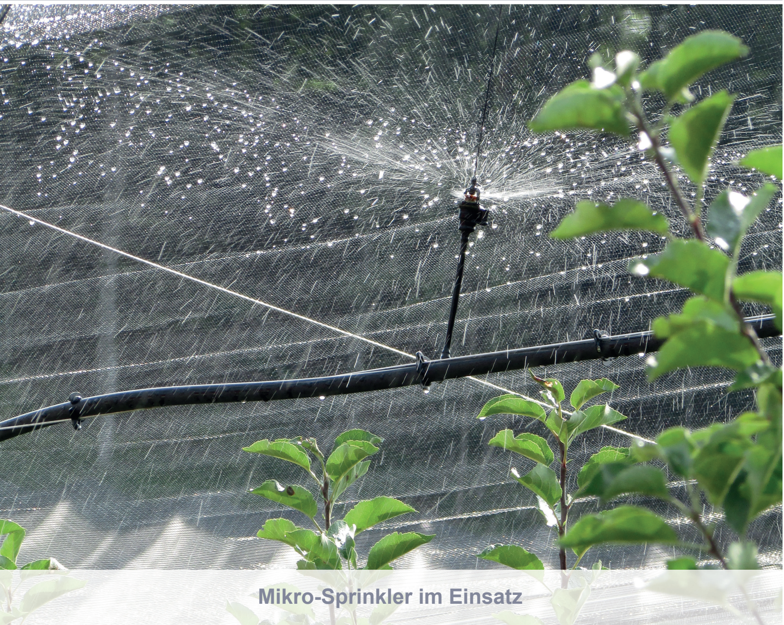
Mikro-Sprinkler im Einsatz