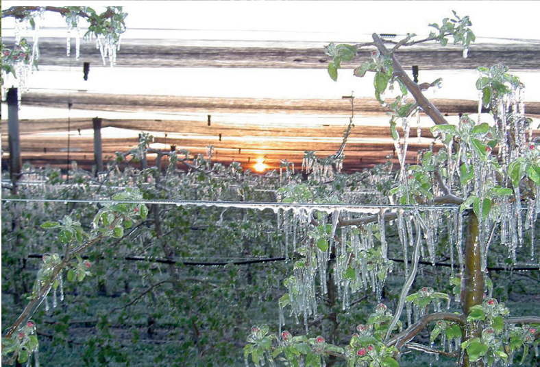
Temperatur -5,5\text{ }^{\circ}\text{C}