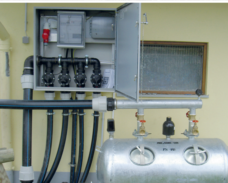
Automatische Steuerungen mit manuellem Filtersystem